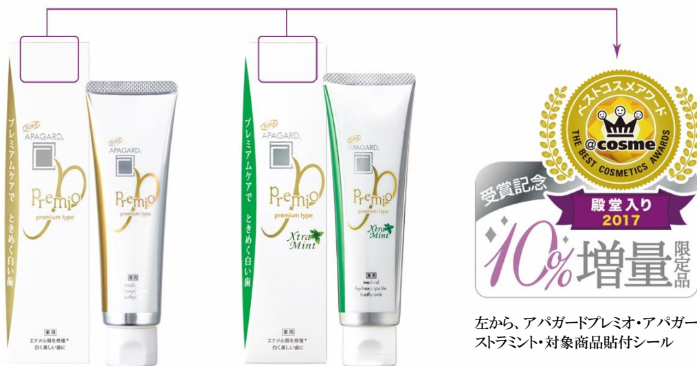
左から、アパガードプレミオ・アパガードプレミオエクストラミント・対象商品貼付シール

美白歯みがき剤「アパガード」の開発・発売元の株式会社サンギは、主力商品の「アパガードプレミオ」が日本最大のコスメ・美容の総合サイト@cosme（アットコスメ）の@cosme ベストコスメアワード 2017において殿堂入りを果たしたことを記念して、2月中旬よりアパガードプレミオ・アパガードプレミオ エクストラミントを10%増量し、30万本限定で発売します。増量品はパッケージ正面上部のシールが目印となります。